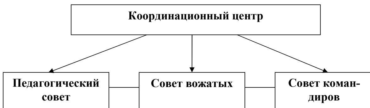
СХЕМА УПРАВЛЕНИЯ ПРОГРАММОЙ